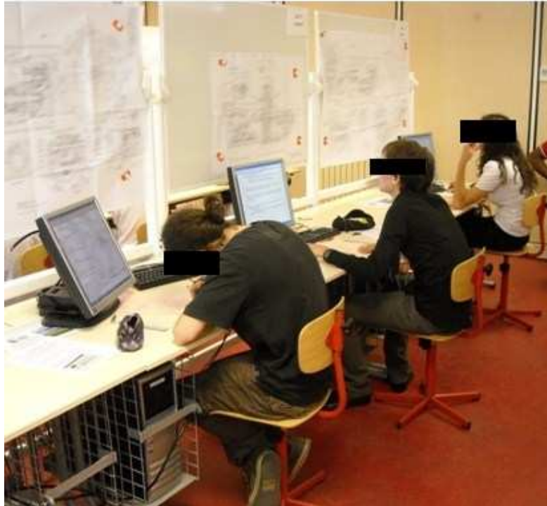
3 candidats en salle de préparation.

La préparation porte sur l'analyse de l'ensemble mécanique en disposant d'un questionnaire portant sur les deux premières parties de l'épreuve. Ce questionnaire constitue un support d'interrogation servant à guider le candidat; son contenu peut éventuellement être limité ou complété par le jury en fonction des réponses fournies et des besoins de l'évaluation.