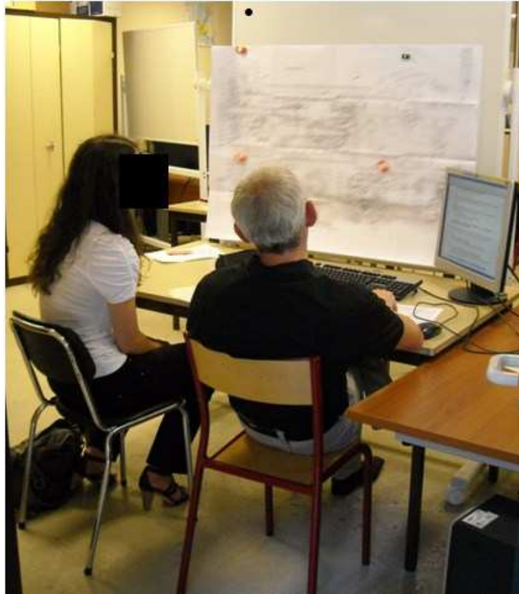
Candidate en phase d'interrogation.

L'épreuve se propose de traiter partiellement une problématique industrielle. La problématique est articulée en trois parties de 20 min, d'importance égale dans le barème: